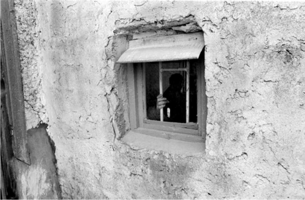
• Фото: Александра Кремер-Хомасуридзе