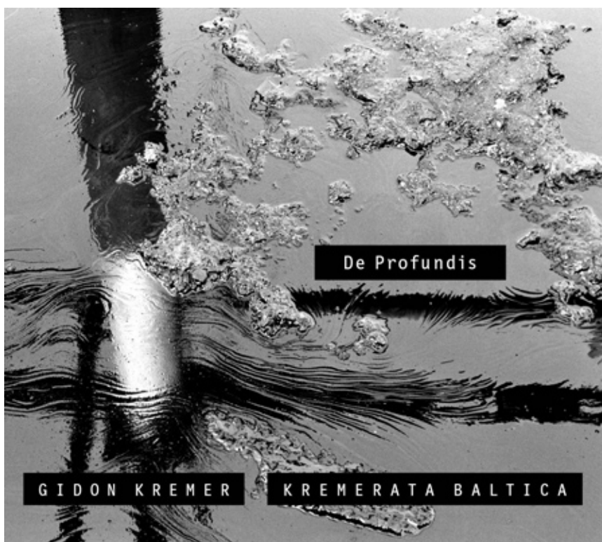
Обложка диска De Profundis

Я хотел бы посвятить этот компакт-диск Михаилу Ходорковскому, истинному российскому патриоту, вынесшему годы тюрьмы в Сибири по сомнительному приговору. Осужденный за хищение нефти и уклонение от уплаты налогов, Михаил на самом деле работал над тем, чтобы сделать свою страну лучше. Бесконечный судебный процесс и его продолжающееся заключение являются важными политическими символами для всех тех, кто стремится к свободной и демократической России