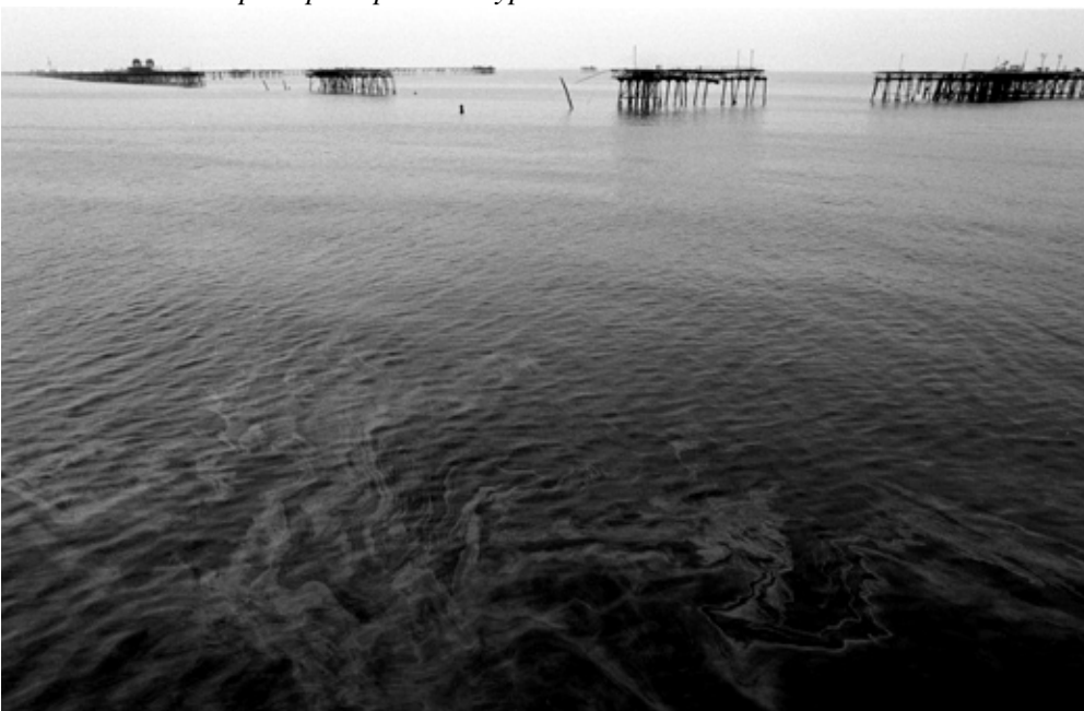
• Фото: Александра Кремер-Хомасуридзе