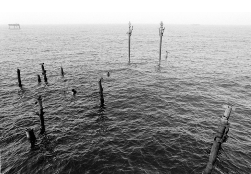
• Фото: Александра Кремер-Хомасуридзе