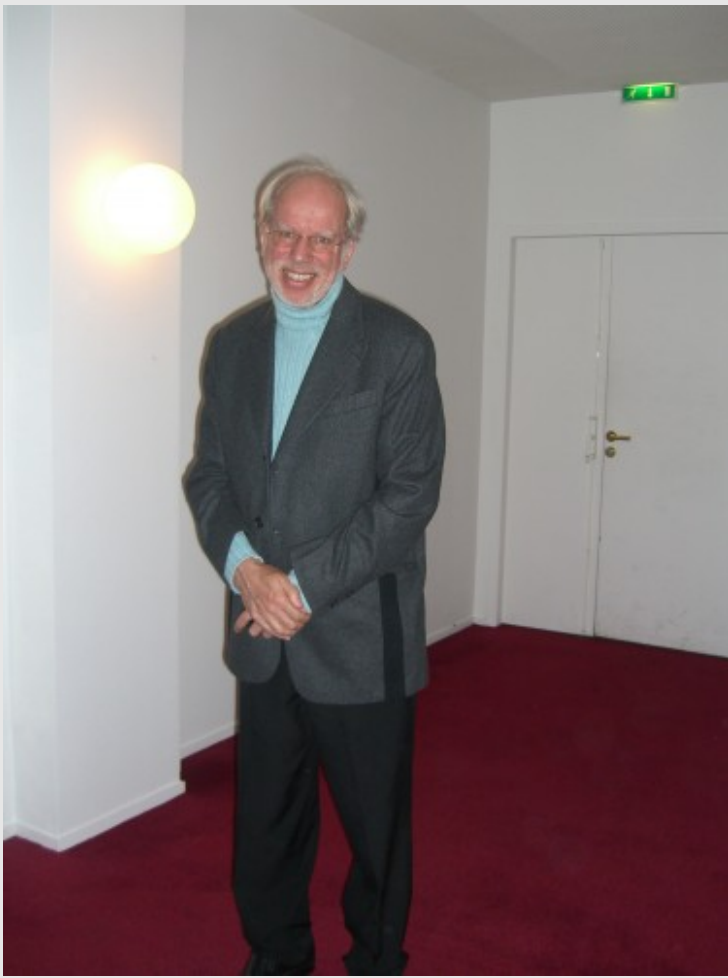
Гидон Кремер после концерта пришел на вернисаж.