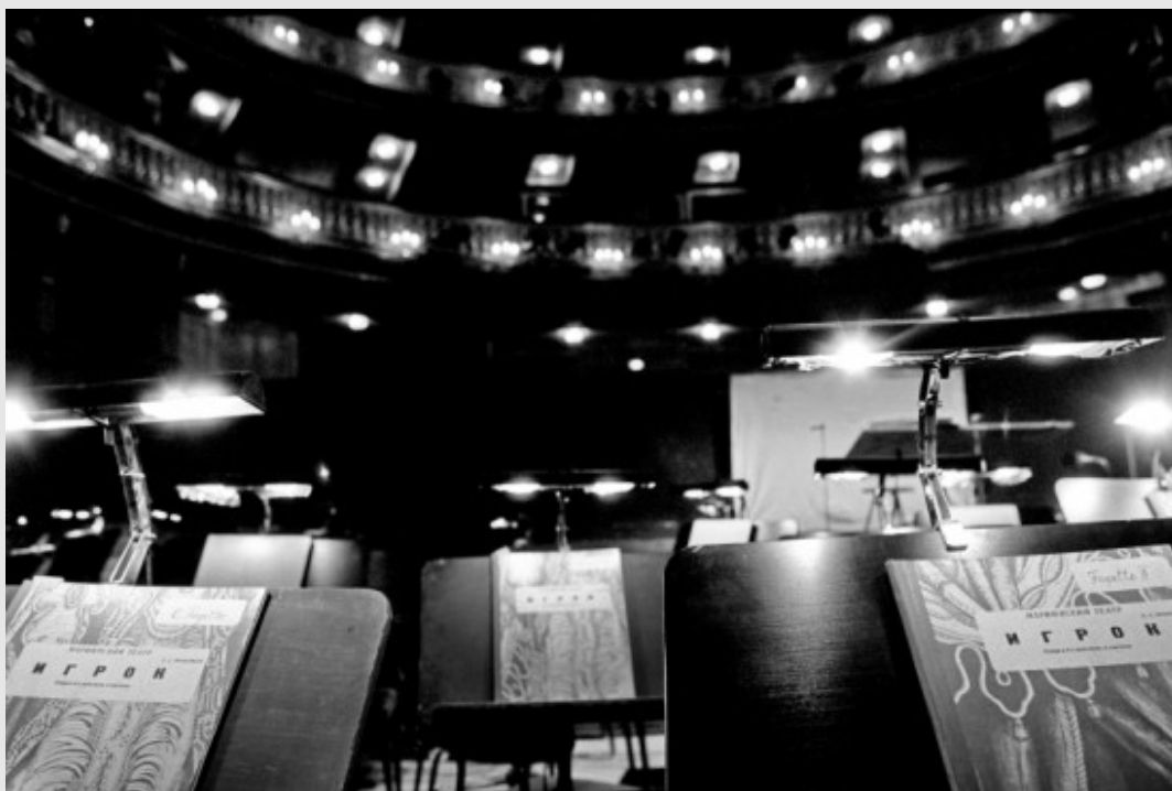
Из книги "Live Music"

Залы живут музыкой, и фотовыставка, которая сейчас проходит в зале Плейель, также наполнена звуками и мелодиями. Она, выставка, кстати, первая в этом великолепном месте. Можно сказать, счастливый прецедент. «Русский очевидец» был там.