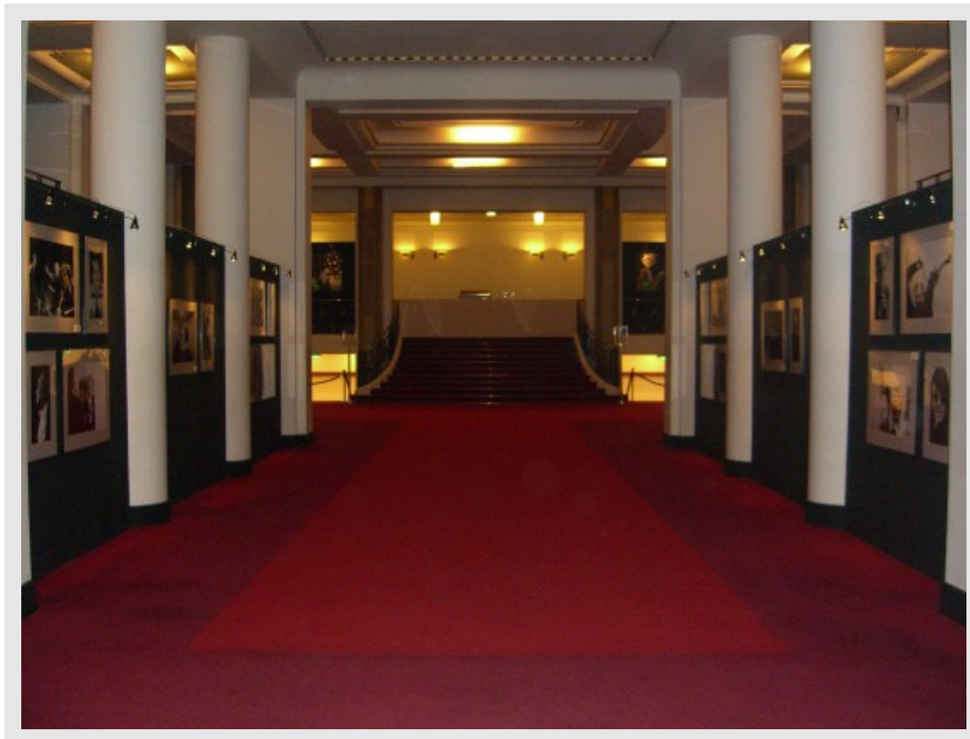
До открытия выставки...

здесь. Фотографии же сделаны в Люцерне и Гштаде, Эвиане и Милане, Вене и Чикаго — там, где они выступают, где их всегда ждут.