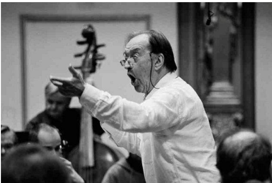
Nikolaus Harnonkourt

Issue d'une famille de musiciens, cette photographe parisienne rapporte: " Pour arriver à photographier ces musiciens, il a fallu franchir des barricades. Leur téléphoner sans cesse, les chercher entre les répétitions et les concerts, et les convaincre qu'on ne les photographierait