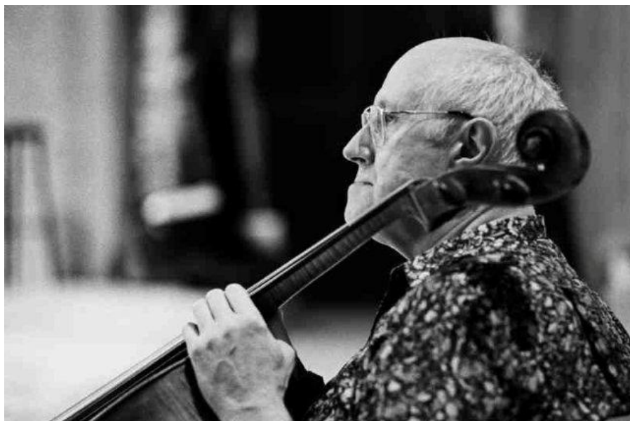
Mstislav Rostropovitch