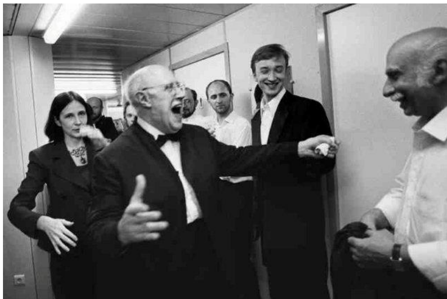
Mstislav Rostropovitch et Guia Kantcheli

Inscrivez-vous pour être averti du lancement du nouveau site Photo