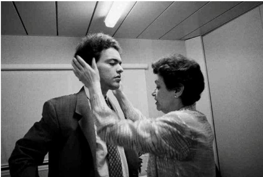
Evgueny Kissin