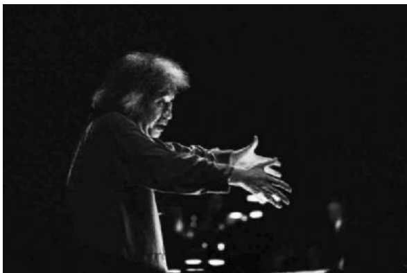
DR Né en 1935 à Shenyang en Chine, Seiji Ozawa est un des chefs d'orchestre les plus reconnus. Son répertoire s'étend de la musique baroque aux créations contemporaines. Exposition Alexandra Kremer-Khomassouridze, salle Pleyel.

La Salle Pleyel ouvre pour la première fois ses portes à la photographie. Elle accueille, du 9 mars au 10 avril, l'exposition « Live music ». Elle regroupe une cinquantaine d'épreuves de l'artiste Alexandra Kremer-Kkomassouridze.